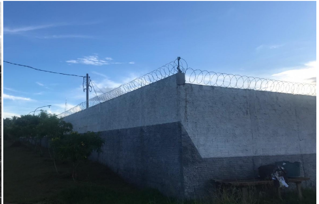
Ampliação do terreno em seis metros, e novo muro, com 4 metros de altura nos fundos.