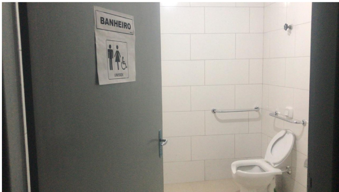
Novo banheiro, construído com acessibilidade .