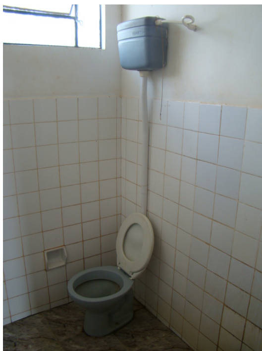
Banheiro deteriorado e insalubre.