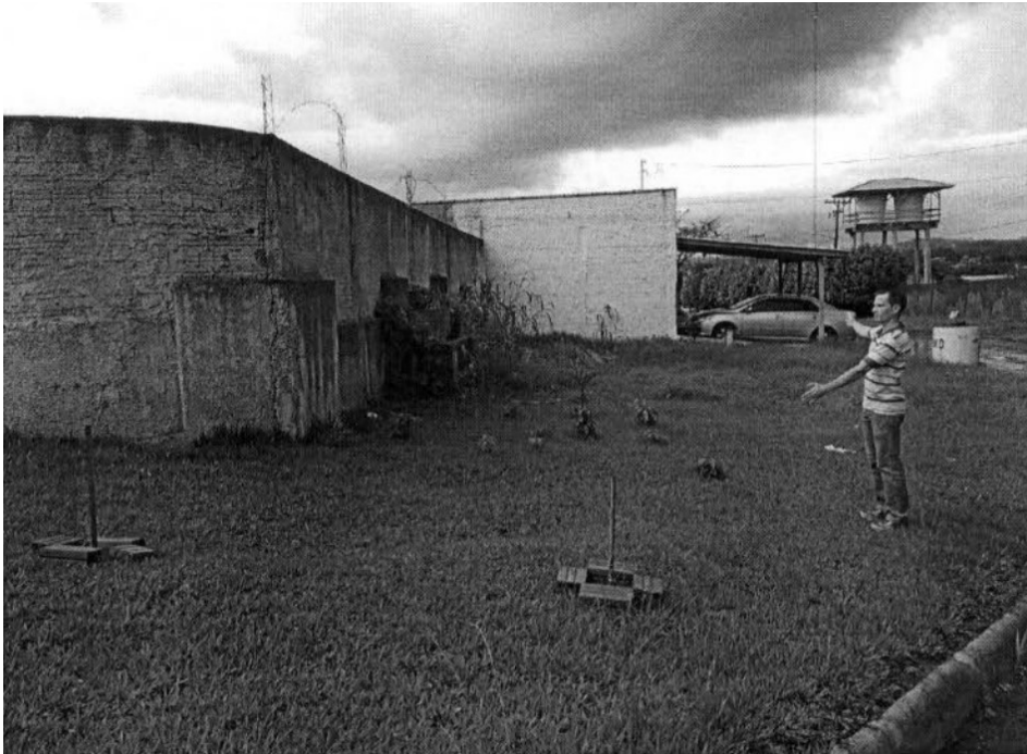
Muro velho e o servidor no local até onde o muro foi estendido.